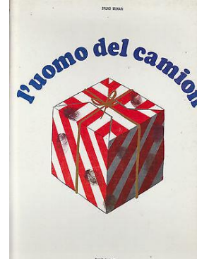
L'uomo del camion, di Bruno Munari