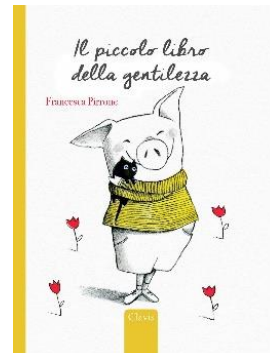
Il piccolo libro della gentilezza, di F. Pirrone